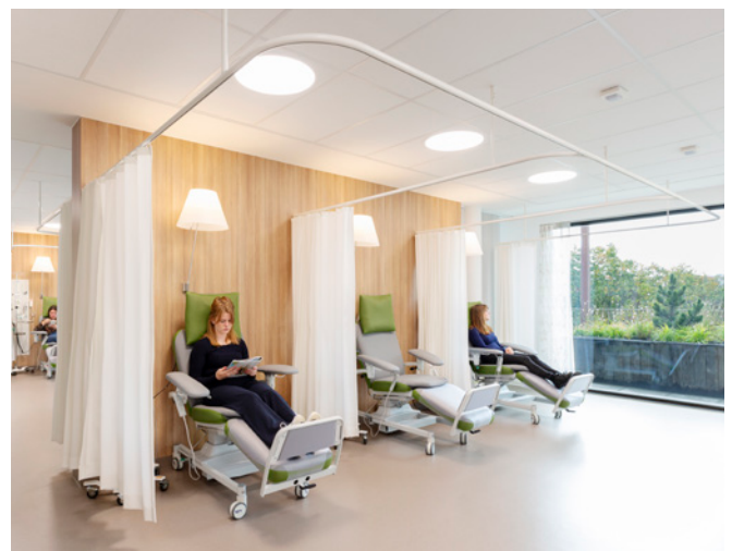
Dagbehandeling oncologie met balkon

Een eerste goed voorbeeld is de dagkliniek voor oncologische patiënten. Deze bevindt zich op de vierde verdieping van het gebouw en kenmerkt zich door een setting waarin vier groepen van ieder drie of zes plaatsen behandeld kunnen worden. Daarmee wordt een bepaalde intimiteit geborgd voor patiënten én wordt een efficiënt zorgproces mogelijk gemaakt. De open behandelkamers hebben grote raampartijen die voor overvloedig daglicht zorgen en een weids uitzicht bieden op de parkachtige omgeving. Je waant je letterlijk tussen de toppen van de bomen. Een dakterras biedt bovendien de mogelijkheid om op zonnige dagen gevoelsmatig echt tussen de natuur de behandeling te ondergaan. Frisse lucht, zingende vogels en het ruisen van de bladeren in de wind geven een serene sfeer aan een emotioneel veeleisende behandeling. Zo vloeit de wereld van de hoogwaardige medische technologie samen met het welzijn van de patiënt. Werelden die elkaar niet tegenspreken, maar juist versterken.