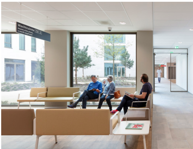
Wachtruimte polikliek met zicht op één van de patio's

Verder kenmerkt het interieur zich door een aantal, schijnbaar kleine elementen die van groot belang zijn voor het ervaren van een prettige omgeving. Zoals bijvoorbeeld de zitelementen die als alkoven in de wanden van de passage zijn ontworpen. Het driezijdig omsloten zitje creëert een veilige plek voor de bezoeker. Een plek waar hij zich even kan onttrekken uit de wellicht hectische omgeving. De zitje zijn gemaakt van hout en hoogwaardige stoffering en zijn zo geplaatst dat ze uitzicht hebben op het omringende parklandschap. De warme materialen in combinatie met het uitzicht staan garant voor het scheppen van nieuwe perspectieven. Het is een goed voorbeeld hoe Tergooi MC met een menselijke schaal ontworpen is. Met recht Zonnestraal 2.0!