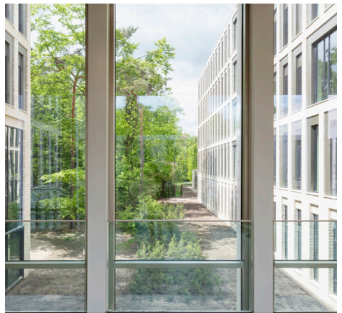
Een van de serre-achtige corridors in de centrale passage

De reductie tot vier materialen (baksteen, aluminium, beton en glas), de aangename proporties en geleiding, het verfijnde ritme in de gevel geeft het gebouw een robuuste maar tegelijkertijd ook zeer elegante en transparante verschijning. Het resultaat is een tijdloze schoonheid passend in het parklandschap. Architectuur zoals architectuur bedoeld is.