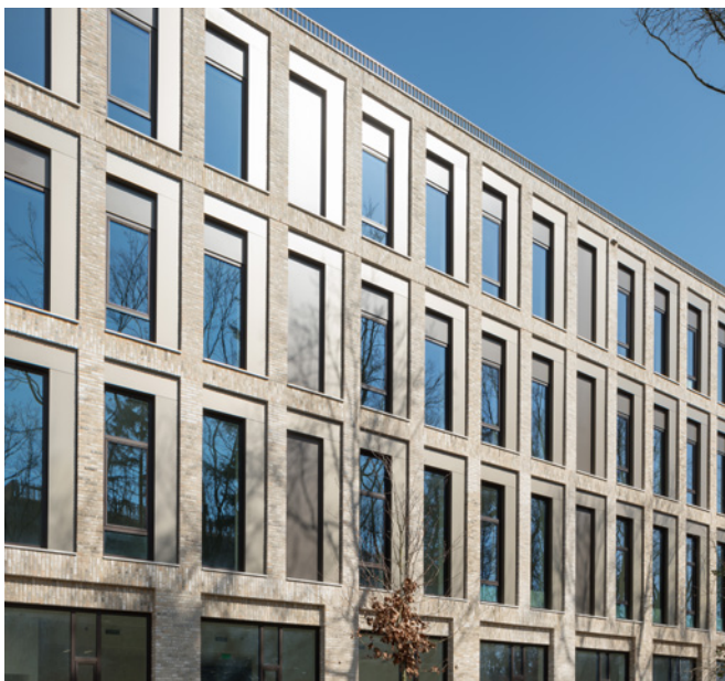
De gevel is opgebouwd uit baksteen, aluminium, beton en glas

Naast het ziekenhuis bevinden zich dus nog drie andere gebouwen op het terrein. Tergooi MC Clinics. Een gebouw waarin specialismen als dermatologie, oogheelkunde, KNO, plastische chirurgie en kaakchirurgie zijn gevestigd. Een eigen gebouw voor deze disciplines geeft de mogelijkheid zich als zelfstandige behandelkliniek te profileren en levert Tergooi MC flexibiliteit in haar vastgoedportefeuille op. Een parkeergarage om te kunnen borgen dat er zo weinig mogelijk maaiveld verloren gaat aan parkeervoorzieningen en een ambulancepost.