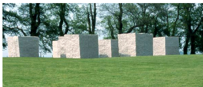
Schloss Dyck van Ulrich Ruckriem

Het nieuwe Tergooi MC staat op meerdere vlakken voor een nieuwe kijk op ziekenhuiszorg in Nederland. Zoals Zonnestraal destijds ook een statement was. Ingebied in een natuurlijk stukje Hilversum zijn ze beiden een toonbeeld van vernieuwing.