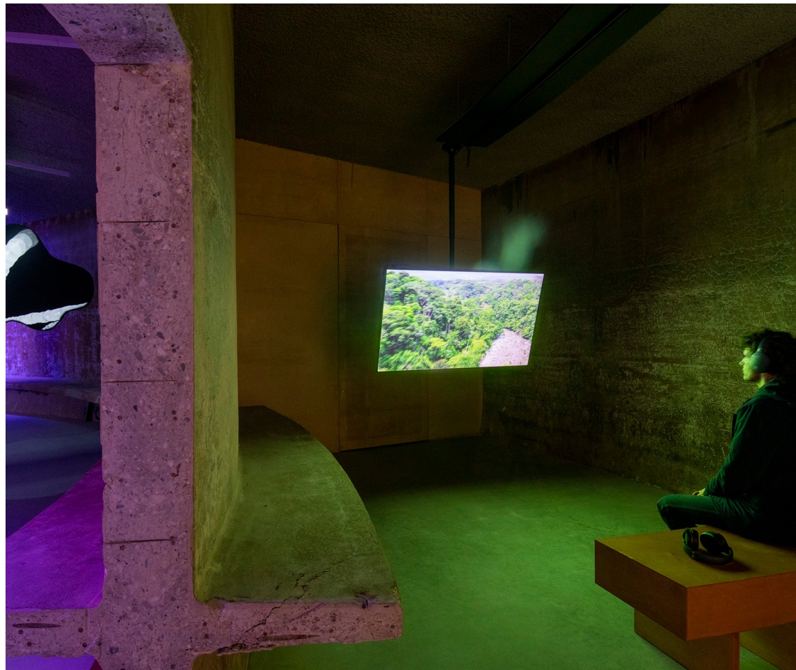
De ruige sfeer in de reinwaterkelder past heel goed bij de thematiek van RADIUS