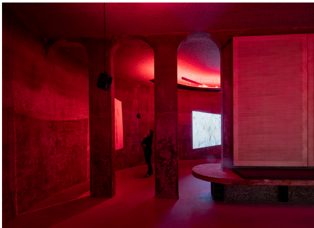
Hart van tentoonstellingsruimte