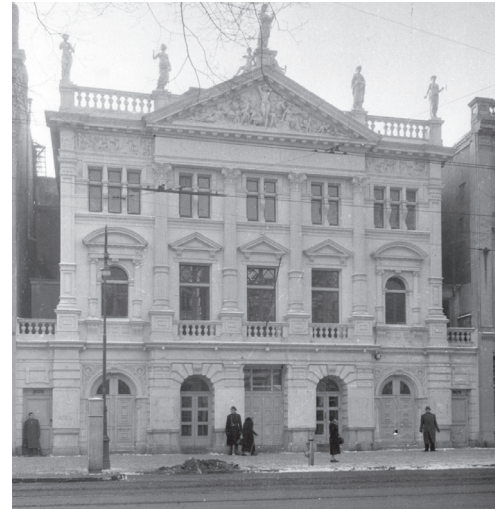
Hollandsche Schouwburg tijdens de Tweede Wereldoorlog met Nazi-bewakers, 1942