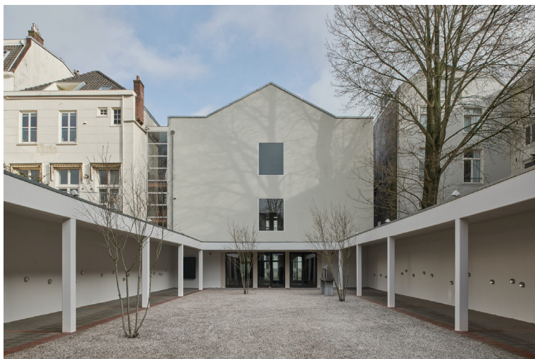
De gerenoveerde binnenplaats van de Hollandsche Schouwburg