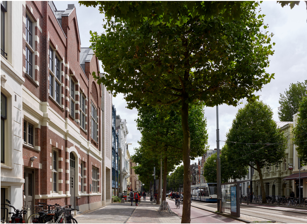
De Plantage Middenlaan met zicht op de Hervormde Kweekschool en Hollandsche Schouwburg