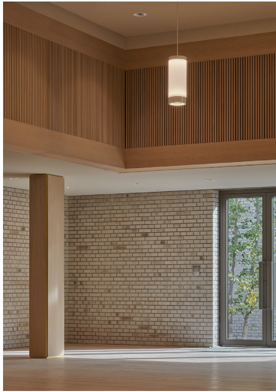
Het auditorium in de nieuwbouw op het achterterrein