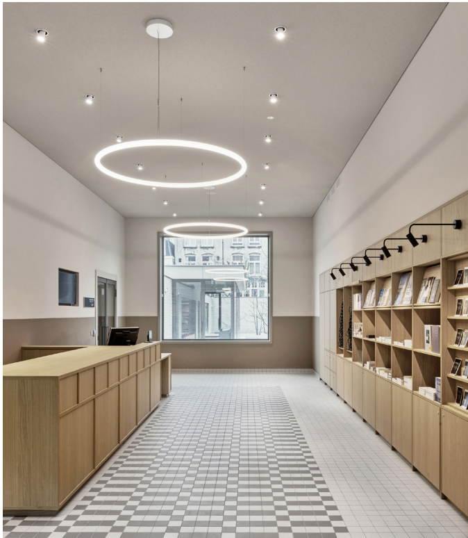
Entree Nationaal Holocaustmuseum