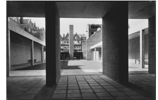
Een open verbinding met de herdenkingsplek ontworpen door Jan Leupen ca. 1960