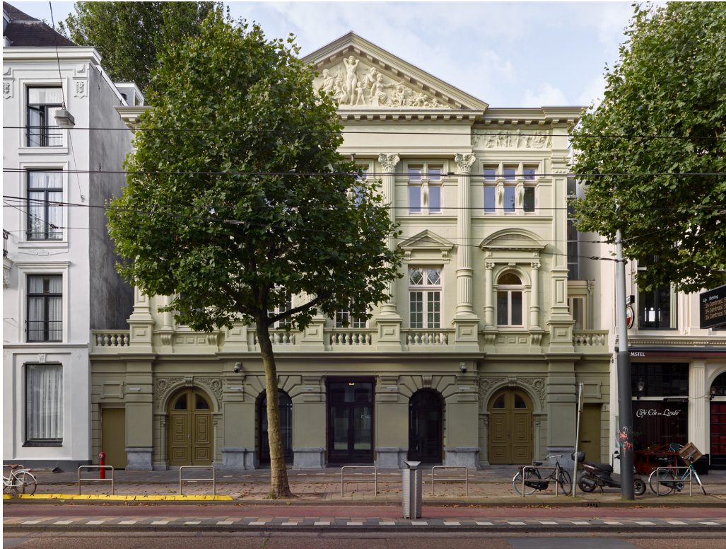
De gevel van de Hollandsche Schouwburg in de oorspronkelijke kleurstelling van Jan Leupen