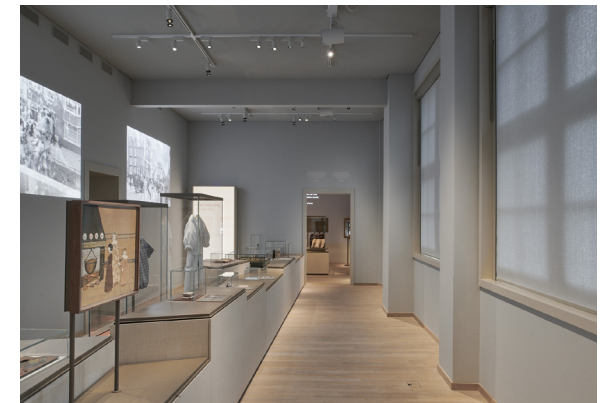
Eén van de vroegere klaslokalen waar zich nu de vaste tentoonstelling bevindt