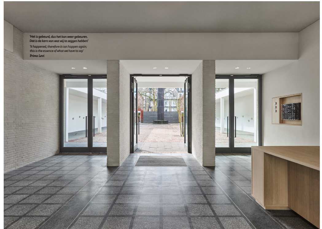
De nieuwe entreehal Hollandsche Schouwburg verwijst naar het originele ontwerp van Jan Leupen