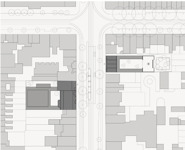
Situatie van de Hollandsche Schouwburg en de Hervormde Kweekschool