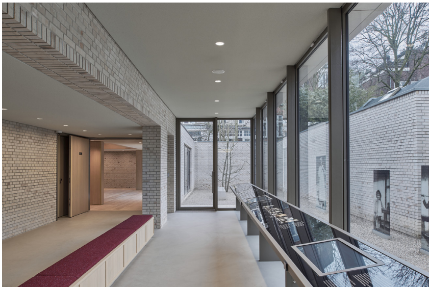
Zicht op de erfafscheiding