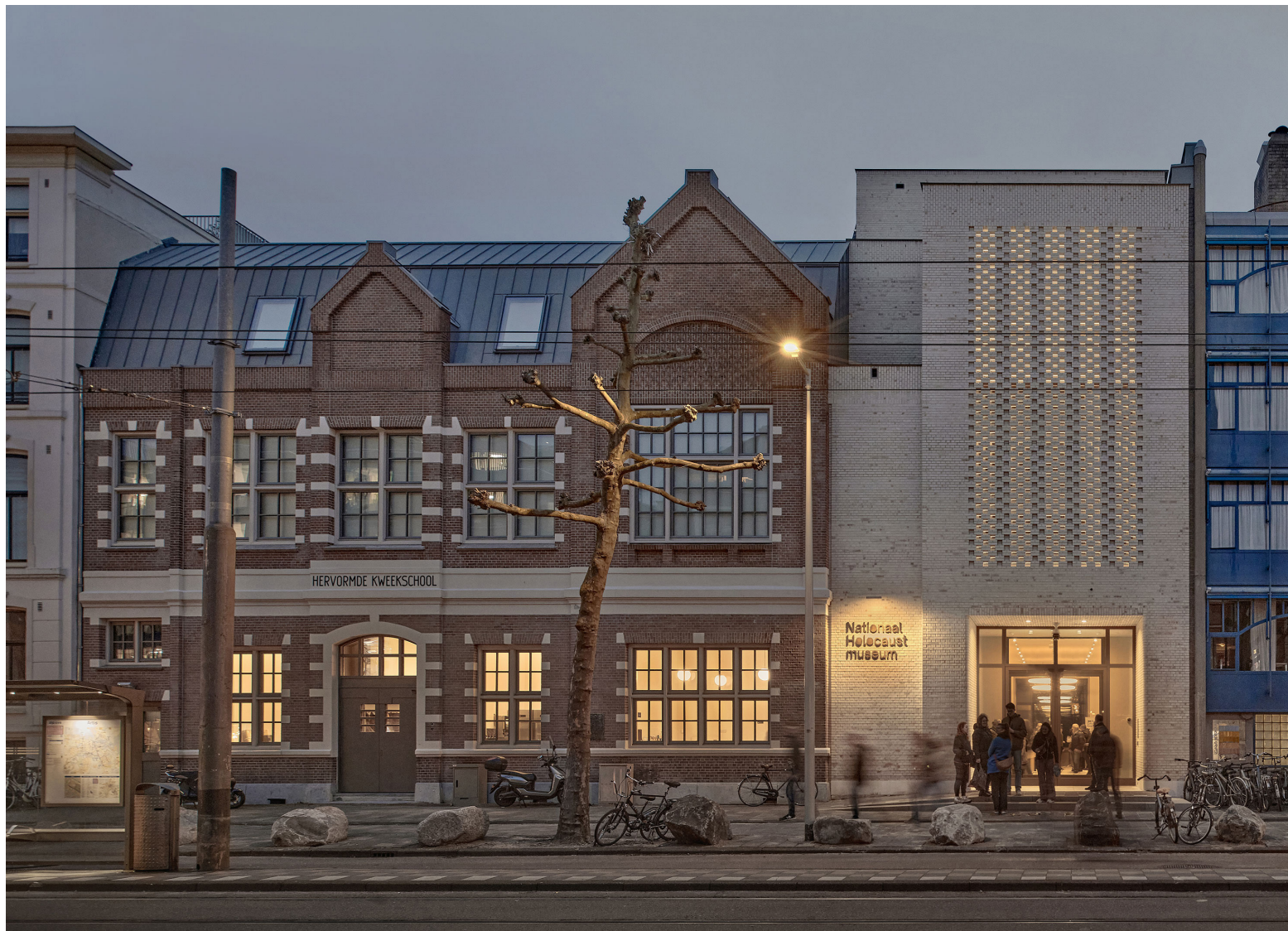
De Hervormde Kweek-school in zijn oorspronkelijke contour en het moderne entreegebouw