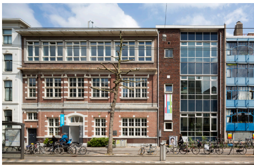
Voor aanvang van de renovatie

Op een bijzondere, beladen plek vertelt het Nationaal Holocaustmuseum de geschiedenis van de Jodenvervolging in Nederland tijdens de Tweede Wereldoorlog. Het museum, geopend in 2024, is gehuisvest in de Hervormde Kweek-school. Het vormt een groter geheel met de Hollandsche Schouwburg aan de overkant van de straat. De Hollandsche Schouwburg, het verzamelpunt van waaruit Joden werden gedeporteerd naar de kampen, was al een herdenkingsplek. Het verhaal van de Hervormde Kweek-school is minder bekend: via dit gebouw werden 600 Joodse kinderen naar onderduik-adressen gebracht. Het museum moet een plek worden om te herdenken en om de geschiedenis aan toekomstige generaties over te brengen. Het doel van het architectonische ontwerp is om de historische elementen van het gebouw die bewaard zijn gebleven, in ere te houden, en om een aaneenschakeling van ruimten te creëren waarin de persoonlijke verhalen uit het verleden voor de museumbezoekers tot leven kunnen komen. Zodat je voelt: dit is hier gebeurd .