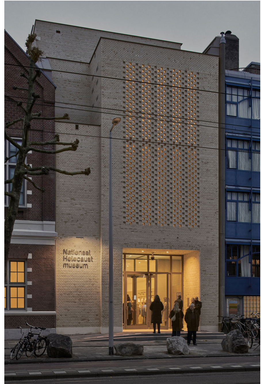
Nieuwe entree Nationaal Holocaustmuseum