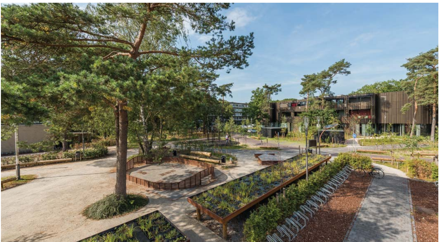
HET ENERGIEPLEIN LEVERT ALS OPENBARE RUIMTE EEN BIJDRAGE AAN EEN DUURZAME TOEKOMST