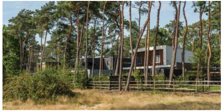
PRIVÉ EN NATUUR GAAN NAADLOOS IN ELKAAR OVER: VANUIT DE VORDEUR STAAN BEWONERS DIRECT TUSSEN DE HEIDE EN HET BOS.