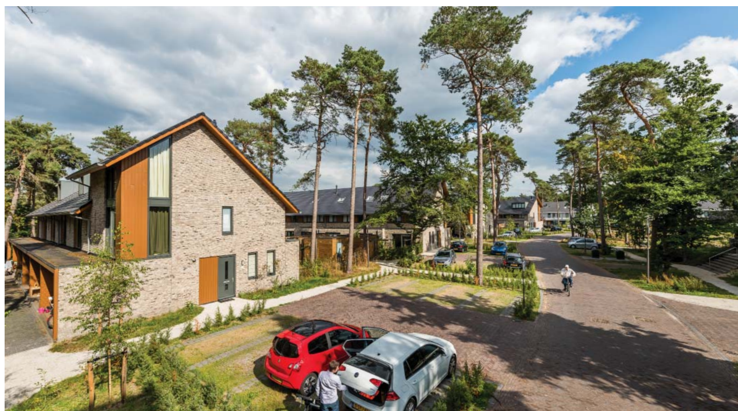
BEWONERS KOMEN THUIS IN EEN BOS. DE PARKEERPLAATSEN ZIJN UITGEVOERD MET NATUURLIJKE MATERIALEN