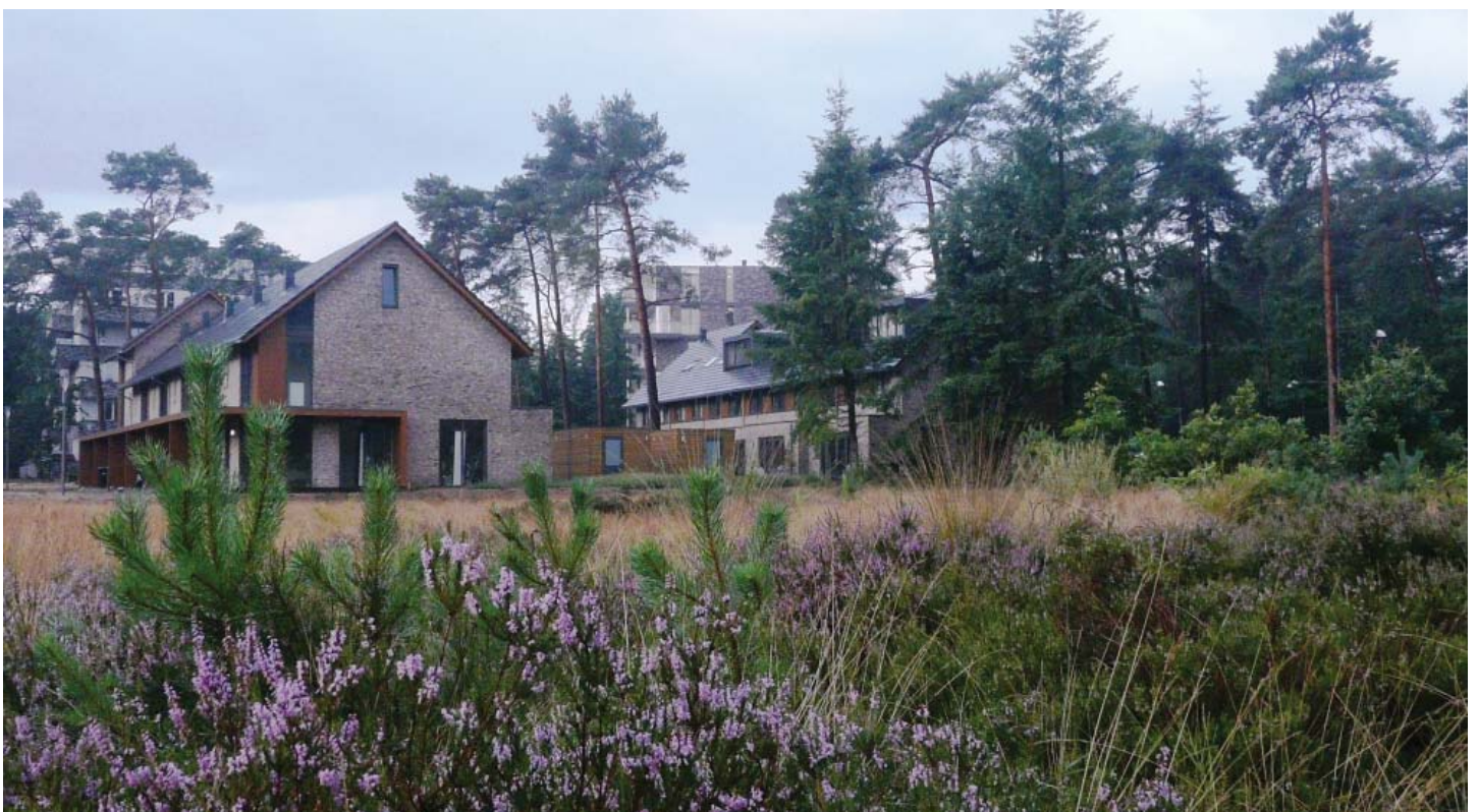
OP SOMMIGE PLEKKEN ZIJN DEZE BOSGEBIEDEN VERRIJKT MET OPEN HEIDEVELDEN WAARDOOR DE ECOLOGISCHE EN VISUELE KWALITEIT WORDT VERSTERKT