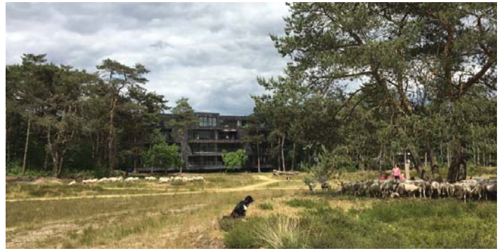
NATUUR EN BEWONERS KOMEN SAMEN IN DE WIJK

WONEN IN DE NATUUR De wijk Kerckebosch te Zeist heeft sinds 2012 een grote verandering ondergaan. Tien van de elf grote flats die in het bos lagen zijn vervangen en hebben plaats gemaakt voor een volledig nieuwe wijk. Als waardevol ruimtelijk uitgangspunt diende het Scheggenmodel uit het door bureau BDP.Khandekar opgestelde Masterplan uit 2008.