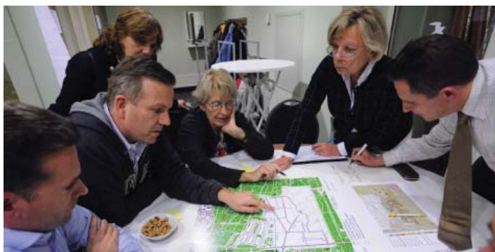
BEWONERS WORDEN ACTIEF BIJ HET INRICHTINGSPLAN BETROKKEN

Een bijzonder element in het plan is het Energieplein, welke zich op de scholencampus bevindt. Met behulp van innovatieve technieken is een Wifi Hotspot gerealiseerd waar op een groene en sociaal duurzame manier stroom wordt opgewekt. Hier kan de jeugd internetten, mobiele telefoons opladen en vrienden ontmoeten.