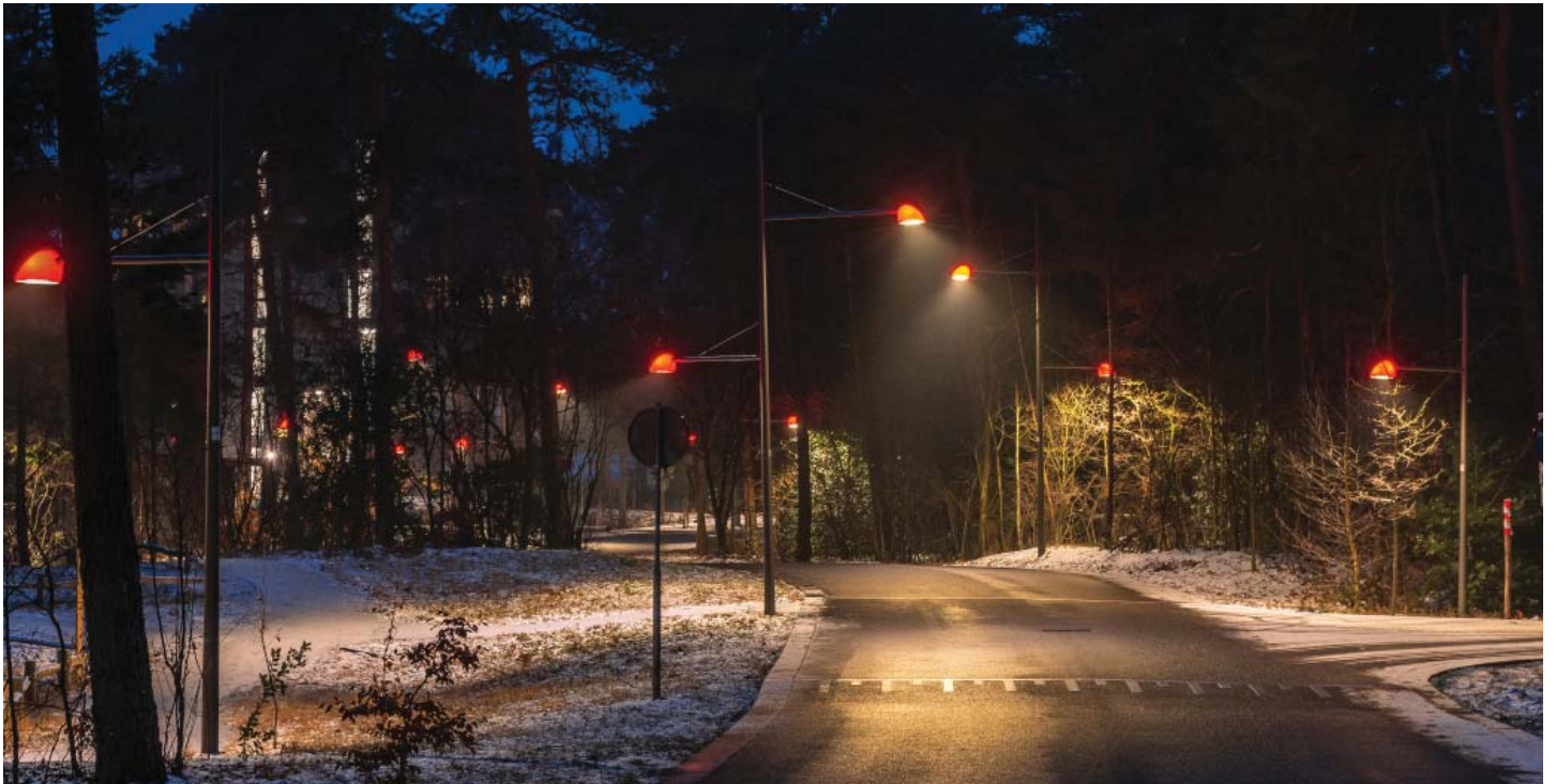
DE 'ROODKAPJES' VERLICHTEN DE WIJK OP EEN SFEERVOLLE MANIER