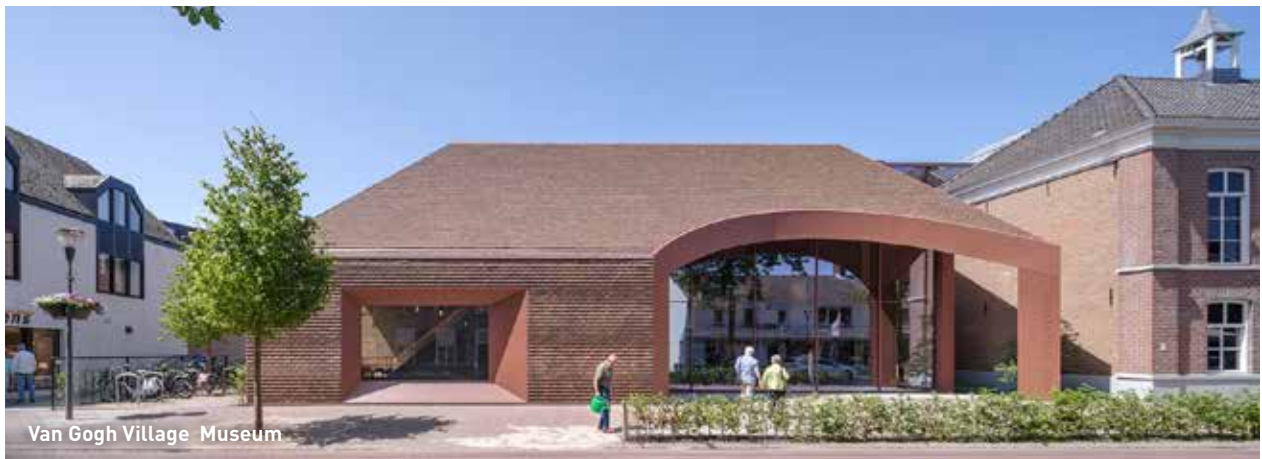
Van Gogh Village Museum