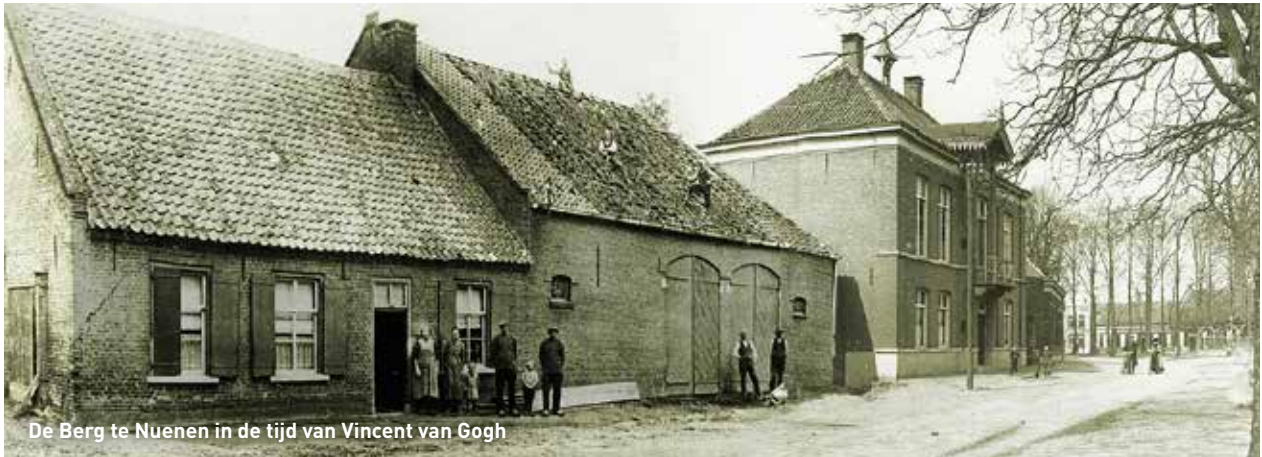
De Berg te Nuenen in de tijd van Vincent van Gogh