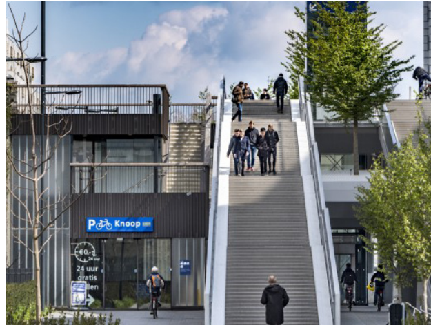
Fietsenstalling de Knoop