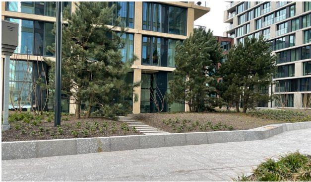
Dichtere begroeiing op het Woonplein zorgt voor een subtiele overgang biedt van publiek naar privaat