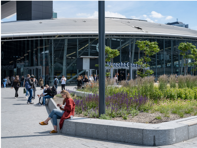
Voorplein bij entree Utrecht CS: duurzame inrichting openbare ruimte