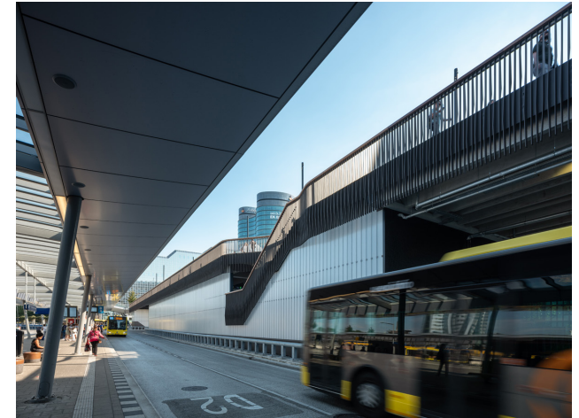
Forum gezien vanaf het busstation; integratie openbare fietsenstalling, logistiek en verhoogd maaiveld. Busstation zonder kruisingen met andere verkeersstromen