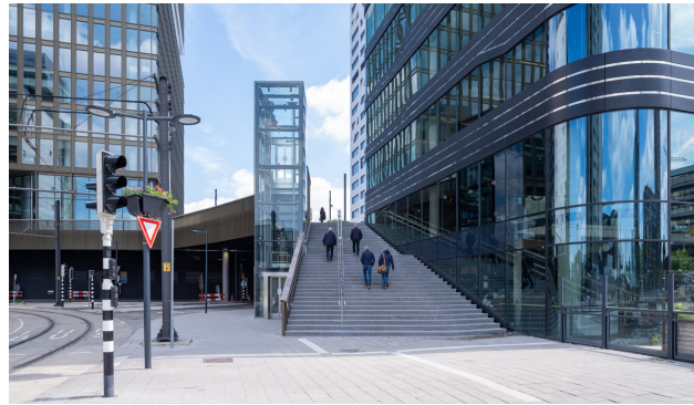
Landschapstrap met bordessen vormt een natuurlijke trekker en tevens baken van het station