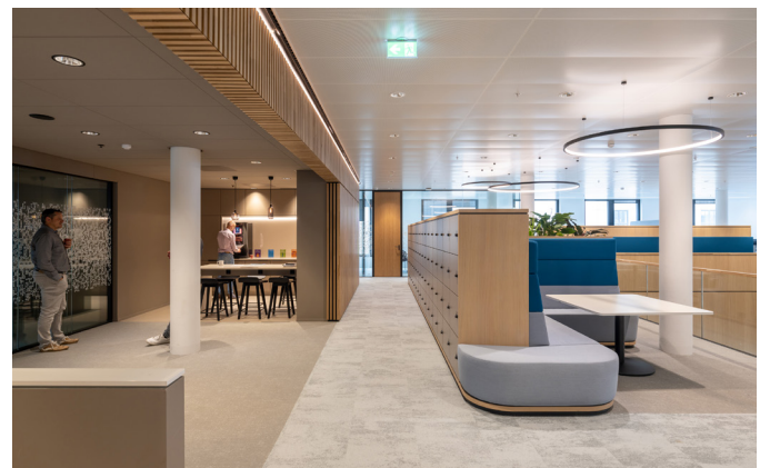
De gebruikte materialen in het interieur dragen bij aan een prettig werkklimaat