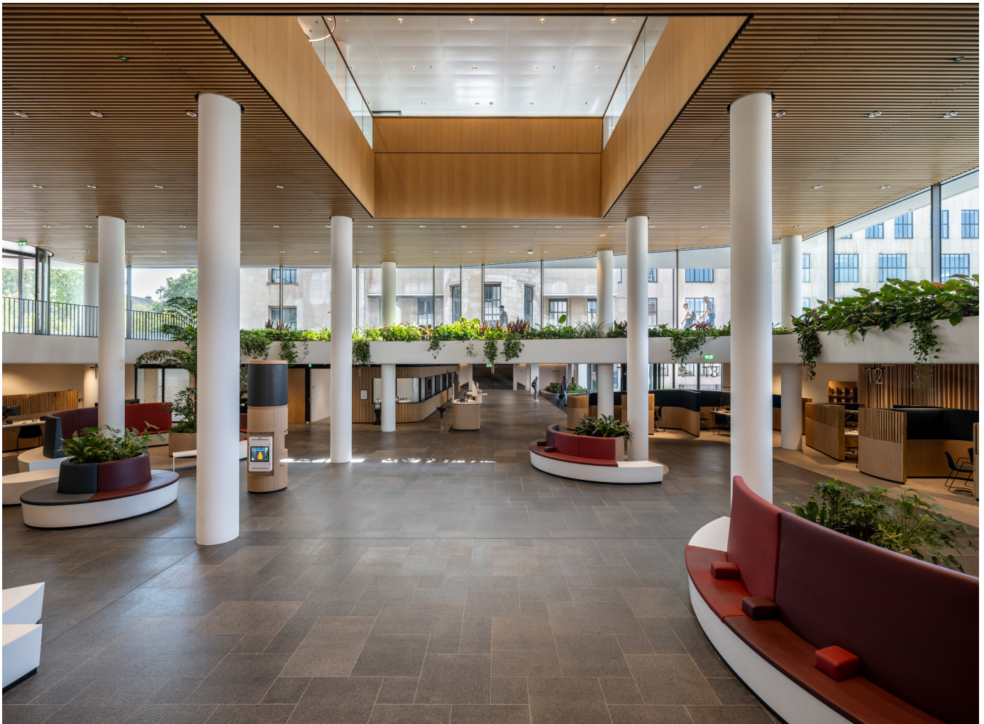
Vanuit de centrale as leidt een interessante route langs een dubbelhoge publiekshal met vide, brede trappartijen en ontmoetingsplekken