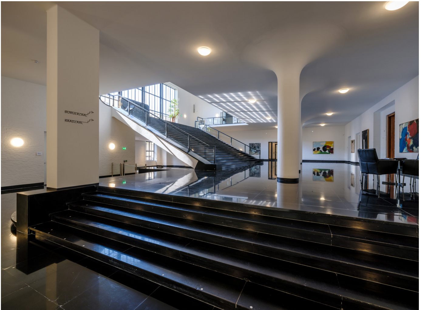
Het Raadhuis van Peutz met haar kenmerkende ronde zuilen en wit metselwerk is zorgvuldig gerenoveerd