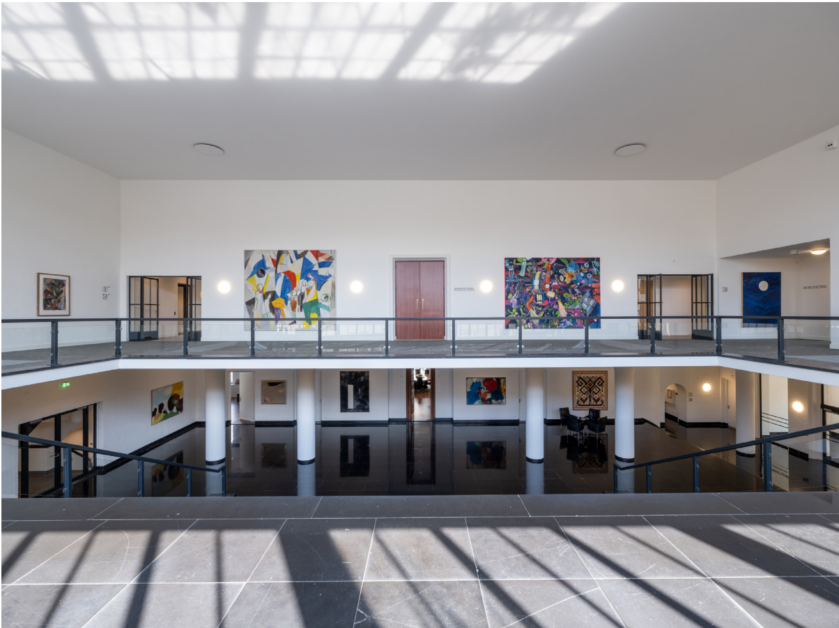
Peutz wilde het publiek, politiek en kunst samenbrengen en daarom gaf hij de centrale hal de sfeer van een tentoonstellingsruimte