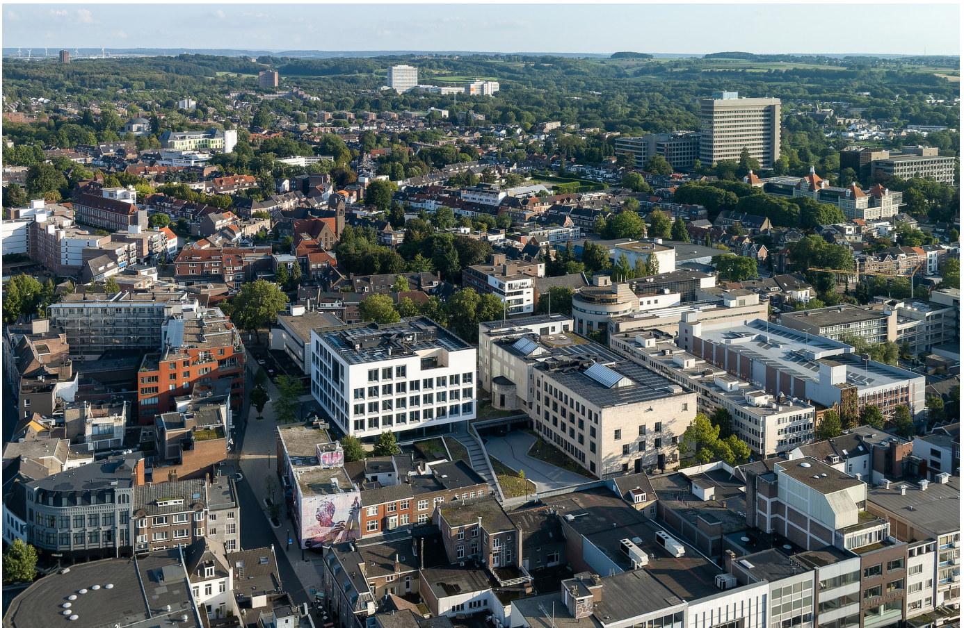
De twee gebouwen vormen een uitgebalanceerde compositie in het Limburgse landschap