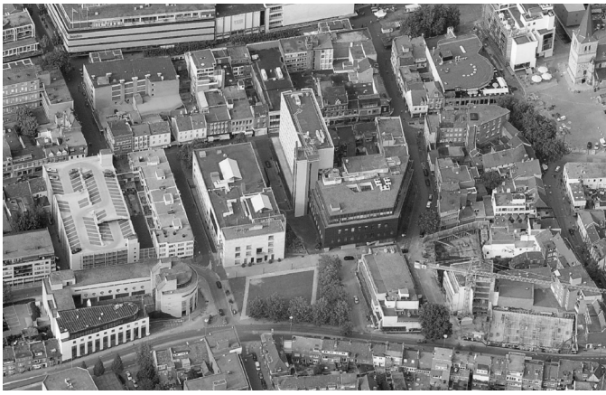
Situatie in 2018: het gebouw met gemeentelijke kantoren aan de rechterkant van het Raadhuis van Peutz wordt gesloopt