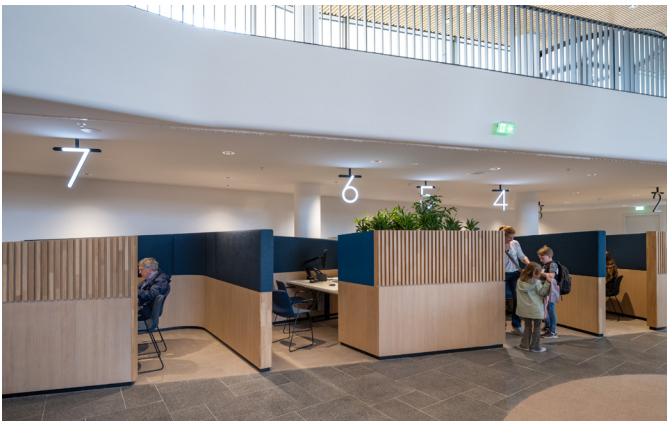
De publiekshal heeft veertien loketten voor informatieverstarring