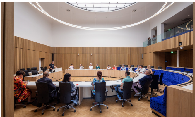
De Raadzaal kreeg een nieuwe indeling en eikenhouten wanden. De bijzondere lamp accentueert het ronde daklicht van Peutz