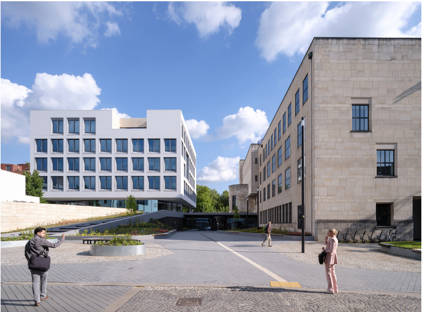
De route naar de entree wordt gemarkeerd door beplanting, bestrating en zitelementen, waardoor het publieke karakter van het Stads Kantoor wordt versterkt