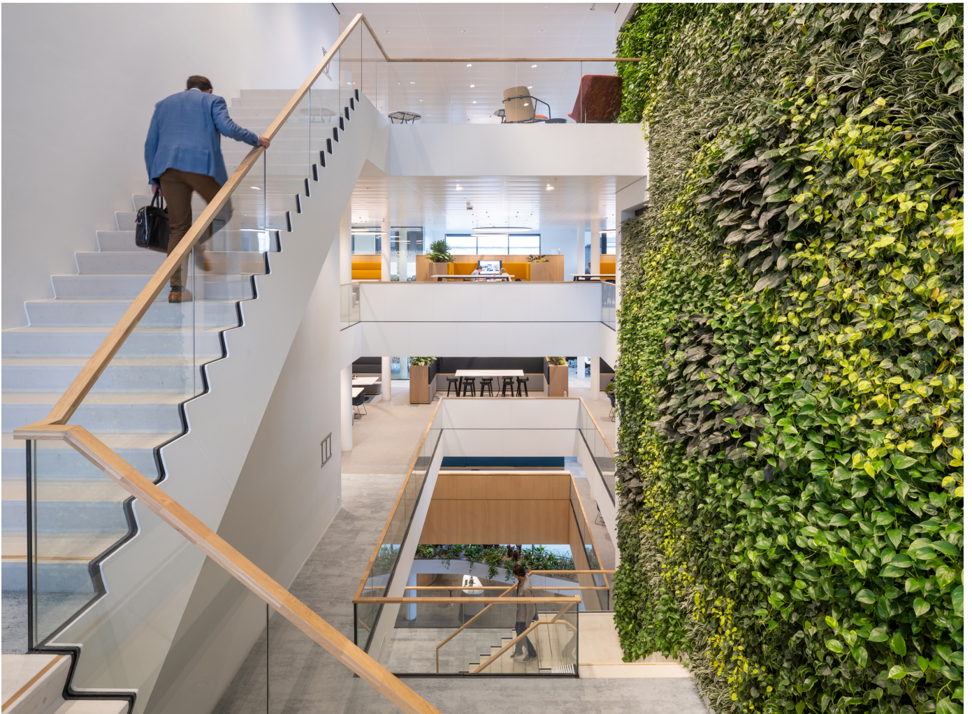
Een vide verbindt de publiekshal met de kantoorclusters op de verdiepingen en creëert visuele relaties tussen medewerkers en met de bezoekers in de publiekshal