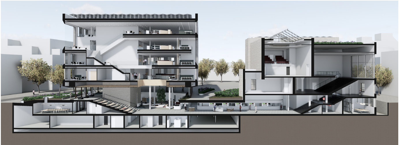
Een centrale as verbindt het Stadskantoor met publiekshal en kantoren op de bovenste verdiepingen (links) met het gerenoveerde Raadhuis (rechts)