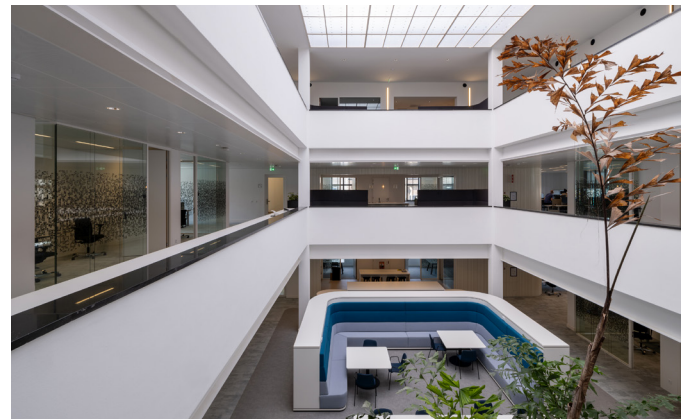
De vide van het Raadhuis heeft een kenmerkend daklicht dat in ere is hersteld