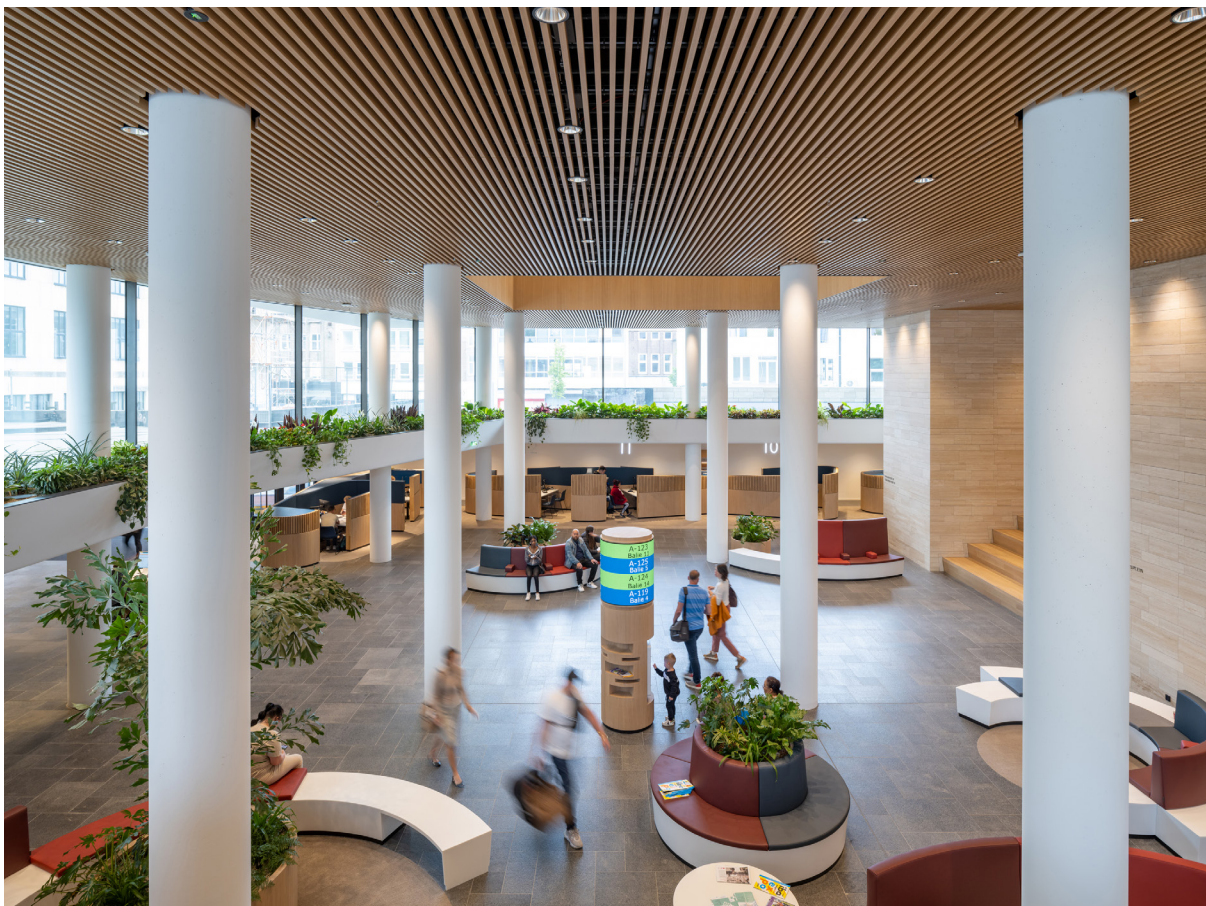
De publiekshal is ontworpen als een huiskamer waar iedereen welkom is en heeft een rijke variatie aan wachtplekken en zitjes