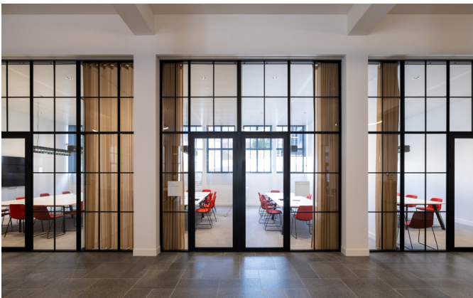
De glazen gevels van het vergadercentrum zijn gerestaureerd en kregen hun oorspronkelijke plaats terug tussen de kolommen