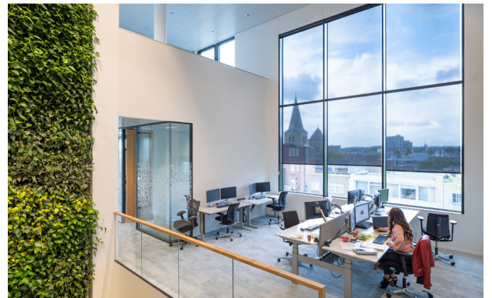
De bureau-werkplekken langs de gevel kijken uit over de stad