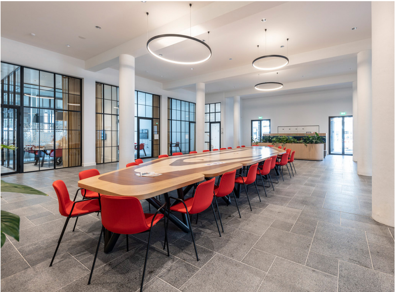
De historische publiekshal in het Raadhuis is in ere hersteld en getransformeerd in een Vergadercentrum met 'ontmoetingsplein'