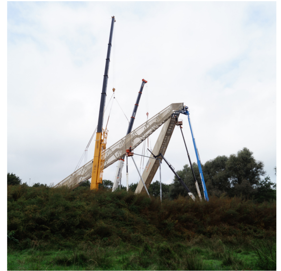
Foto's hijsdag door Ton Aalbers Foto's na oplevering door Stijn Poelstra