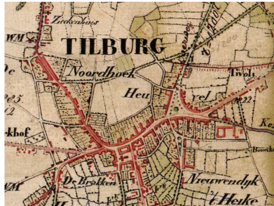
Historische kaart waarin de structuur met herdgangen goed te herkennen is