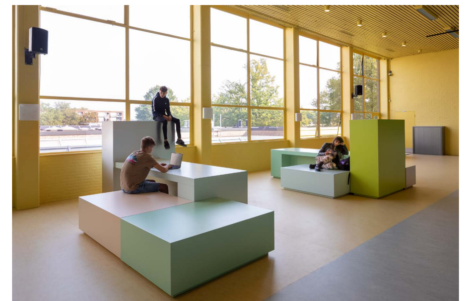
de Marke Zuid

we zitten altijd met hetzelfde groepje op hetzelfde blok het is echt onze plek geworden!