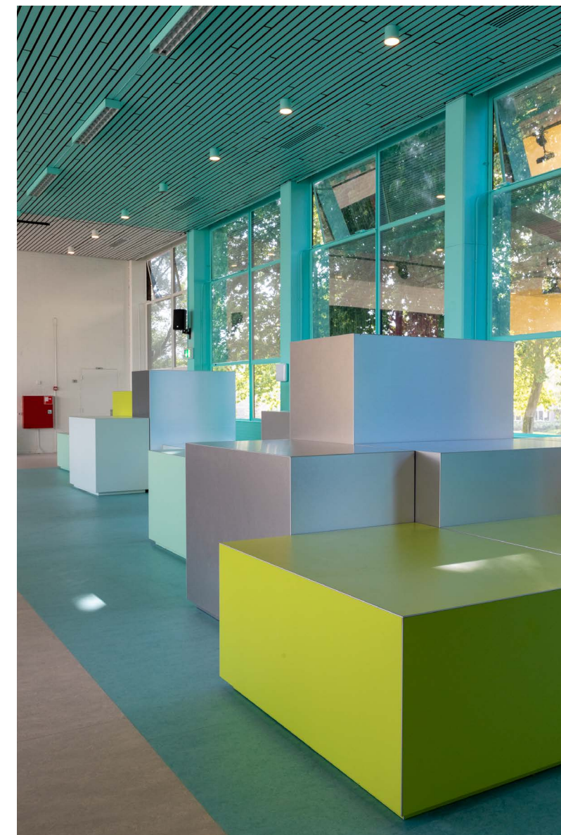
de Marke Zuid