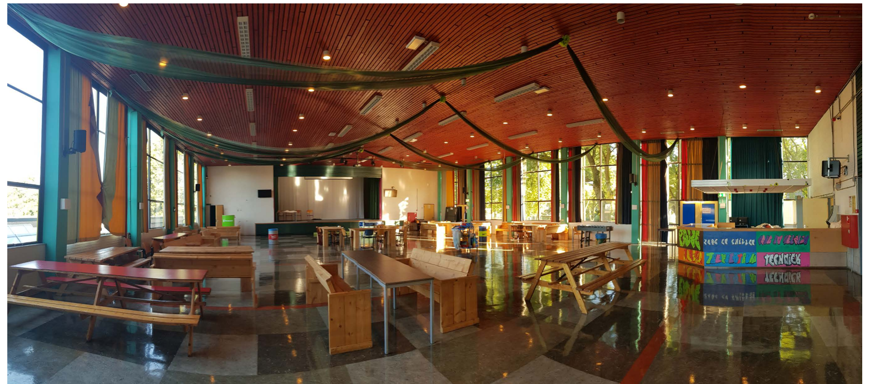
de Marke Zuid (bestaand)