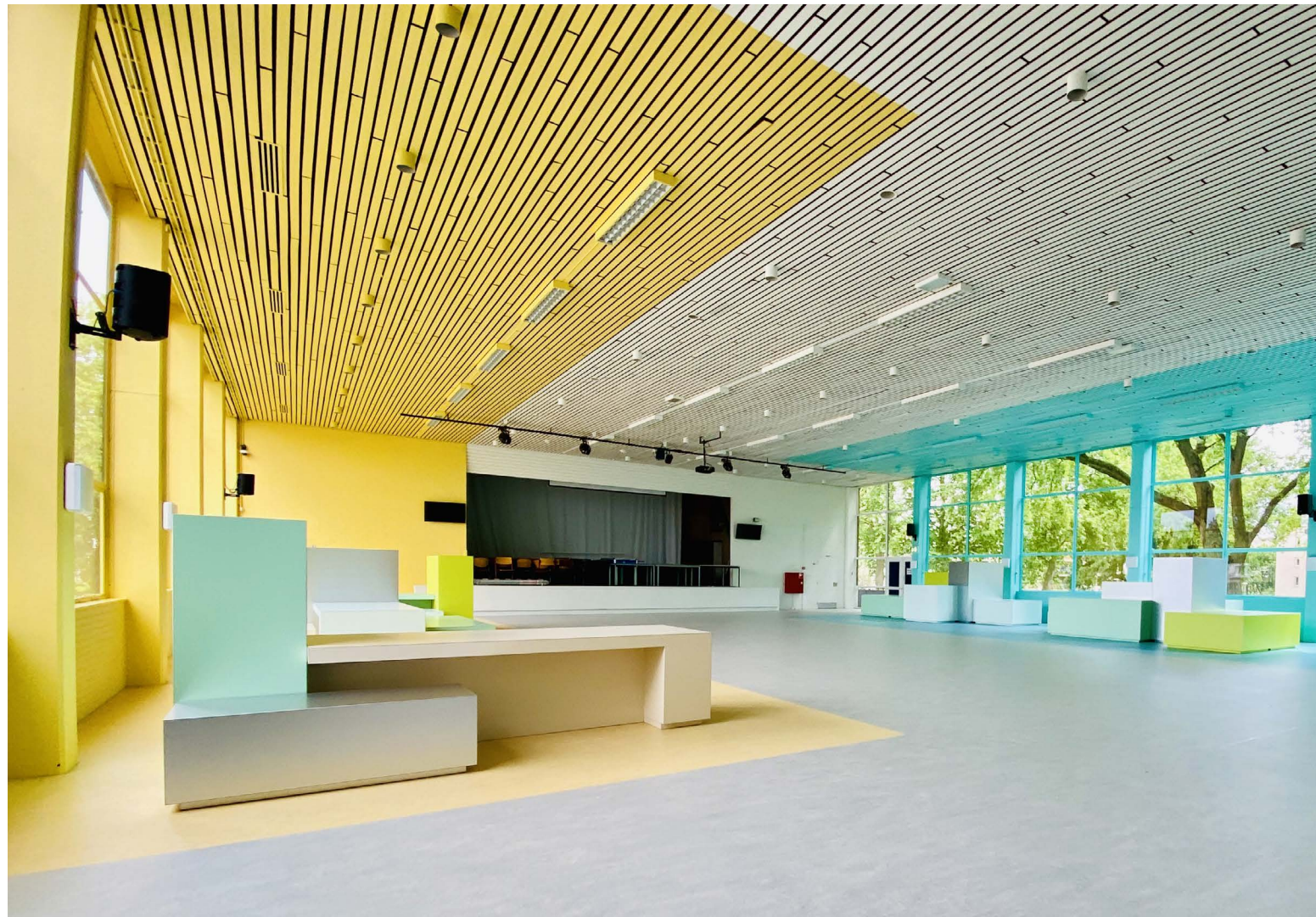
de Marke Zuid

Doordat we de kleuren op de vloer, wand, plafond of meubels zetten, lijkt het net alsof de kleuren de totale ruimte vormgeven.