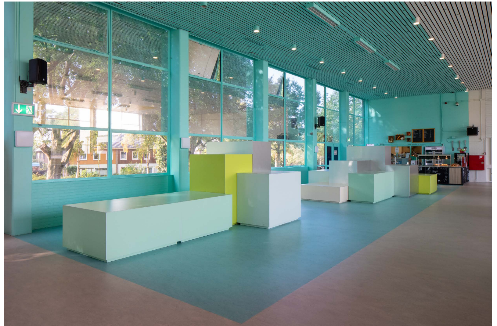
de Marke Zuid