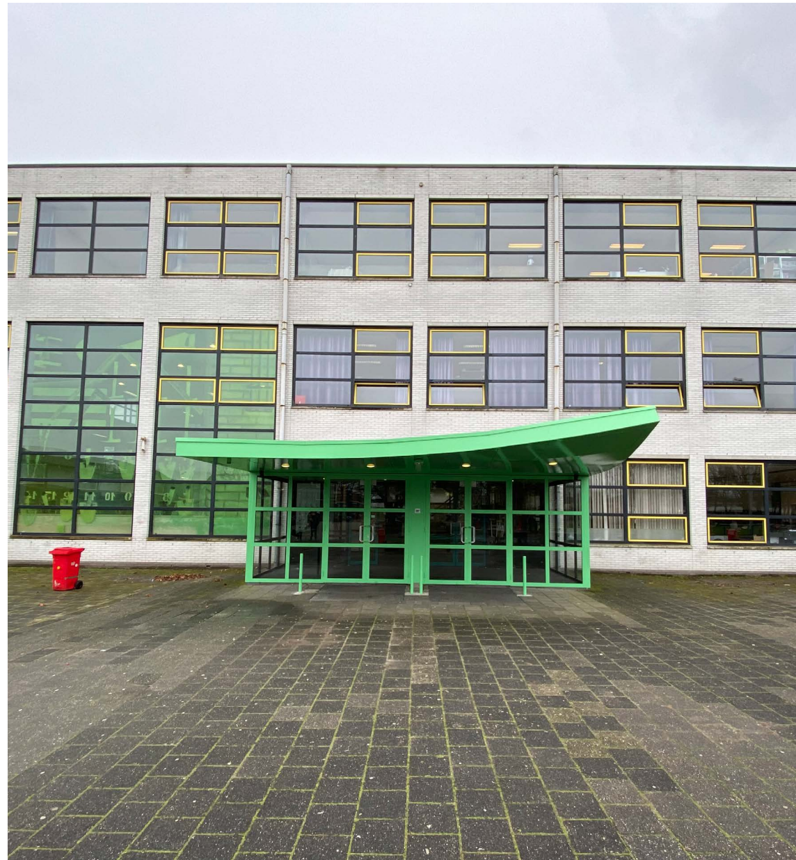
entree de Marke Zuid