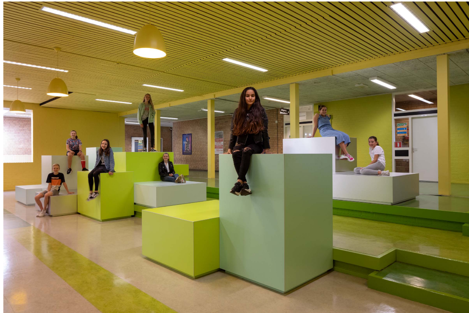
de Marke Noord

we zitten altijd met hetzelfde groepje op hetzelfde blok het is echt onze plek geworden!