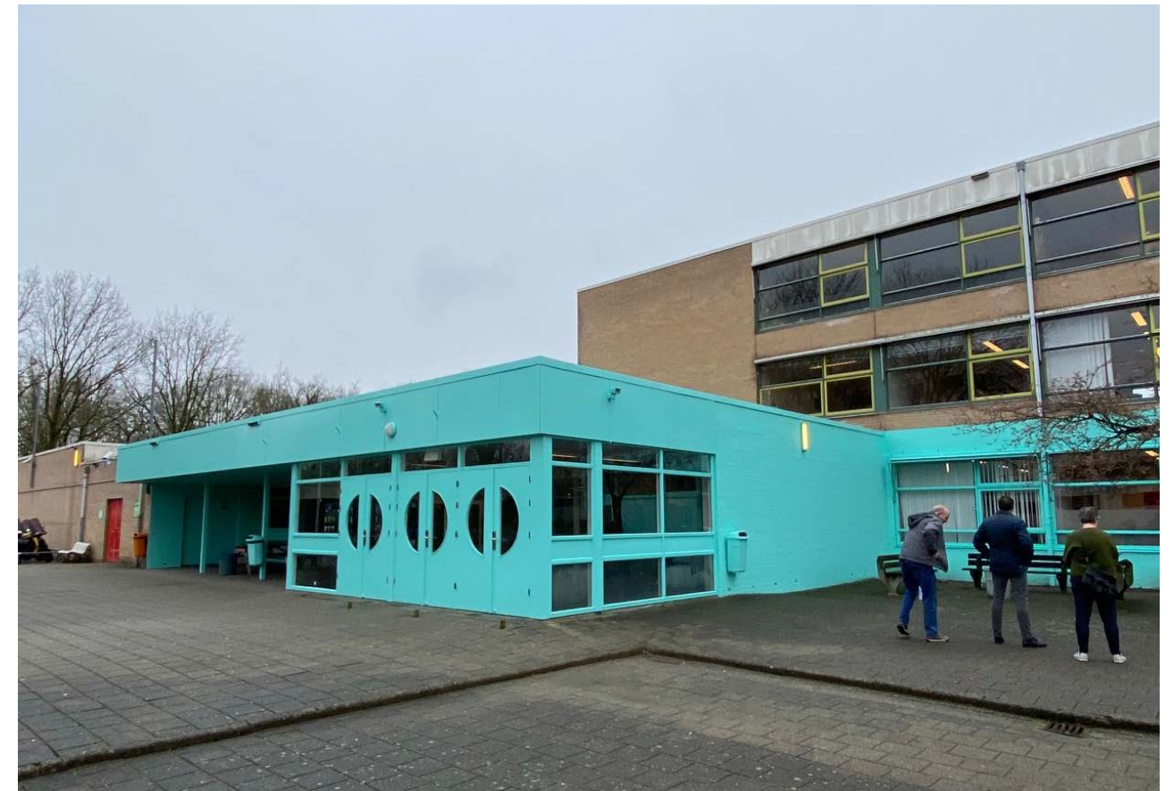
entree de Marke Noord

onze schoolkleuren stralen nu echt, ze hebben lef en zijn stoer!