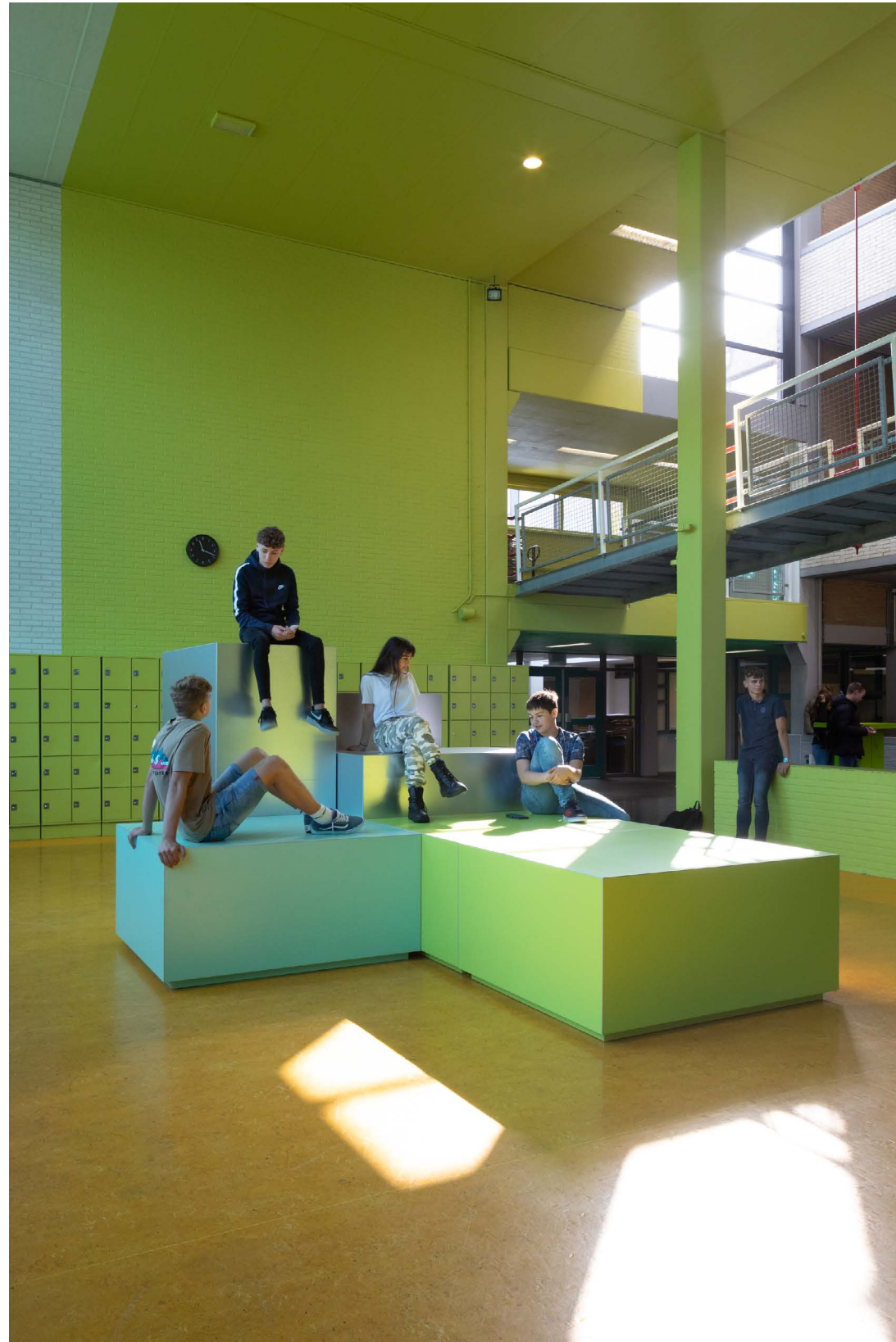
de Marke Zuid

grappig hoor! ik krijg geen waarschuwing, ik mag nu gewoon met mijn schoenen op het meubel