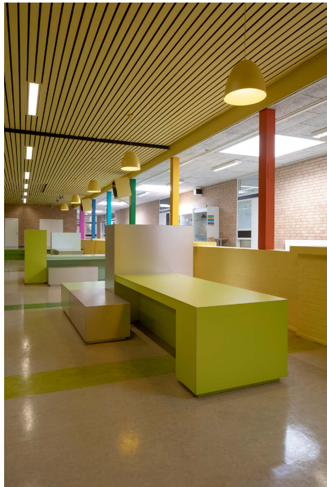
de Marke Noord

oppervlak (Noord): 11.000 m 2 oppervlak (Zuid): 13.000 m 2 start ontwerp: november 2019 start bouw: februari 2020 oplevering: mei 2020