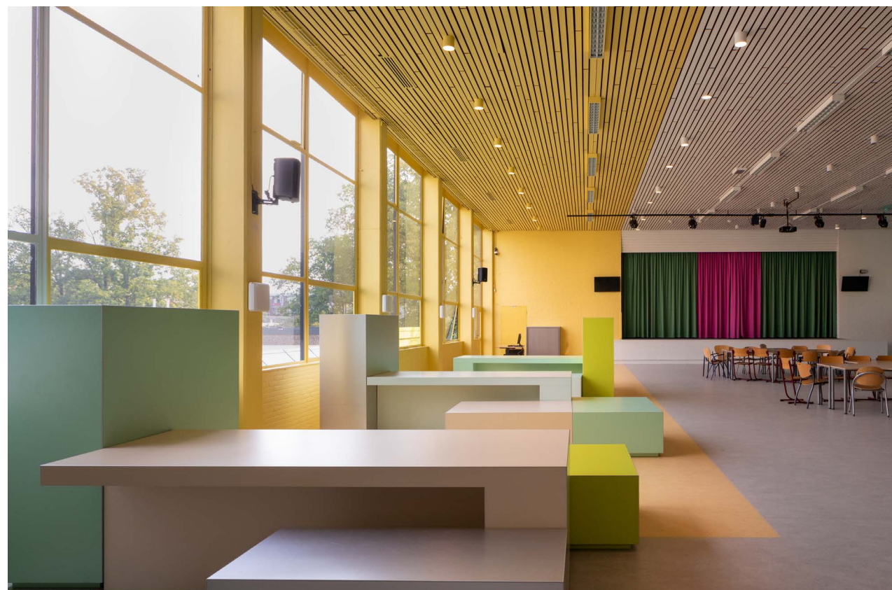
de Marke Zuid

leuk hoor al die verschillende kleuren, ziet er vrolijk uit!