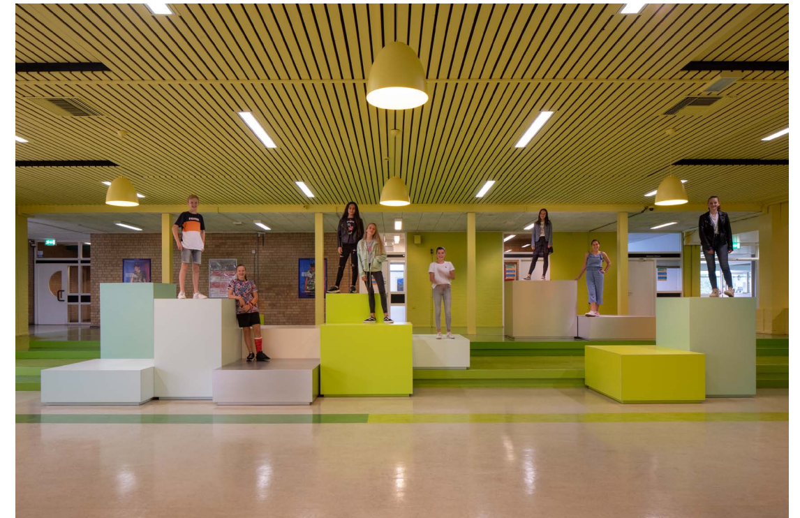
de Marke Noord