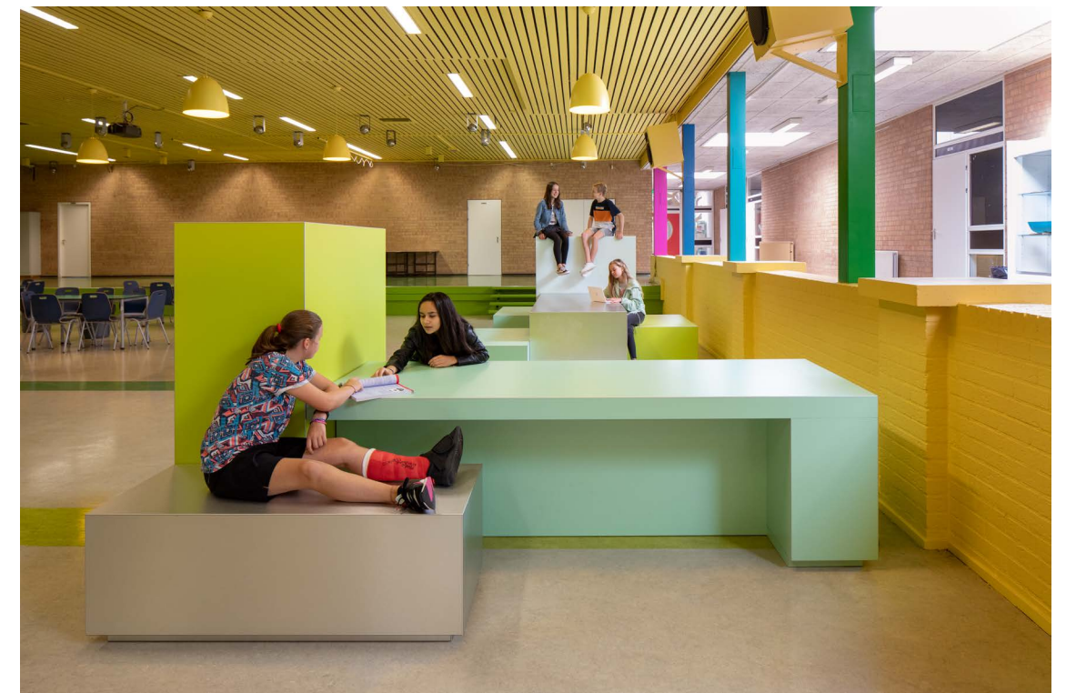
de Marke Noord

grappig hoor! ik krijg geen waarschuwing, ik mag nu gewoon met mijn schoenen op het meubel