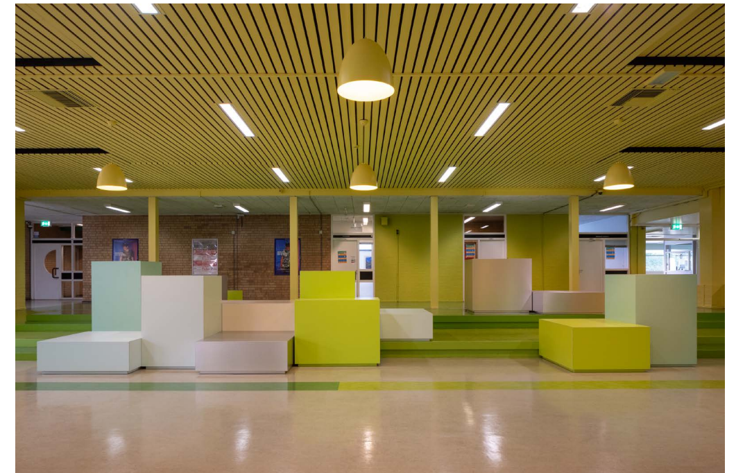
de Marke Noord