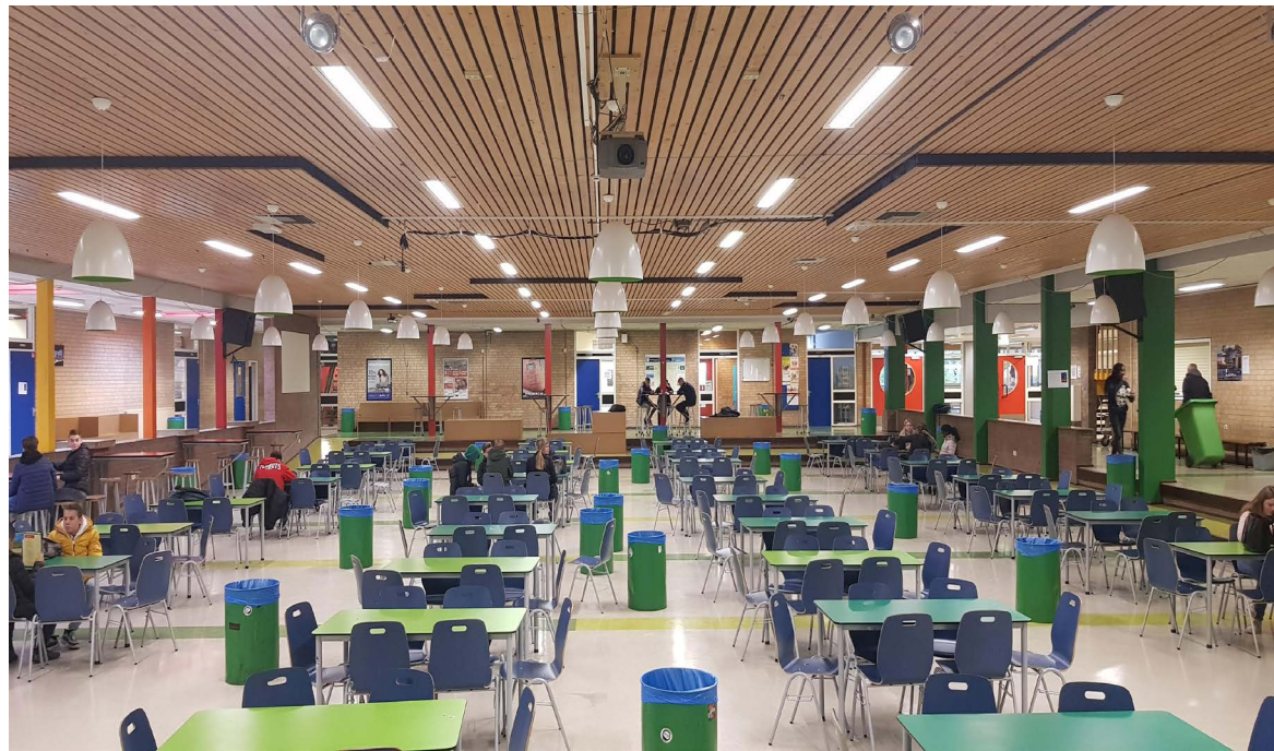
de Marke Noord (bestaand)

Dit hebben we samen met de de teams van de beide locaties opgepakt. De muren zijn opgeschoond, elektradraden aan het plafond zonder functie zijn weggehaald. Alleen de opruimactie geeft al een totaal ander beeld, het zorgt voor rust in het het gebouw.