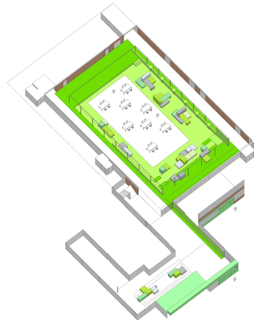
de Marke Zuid