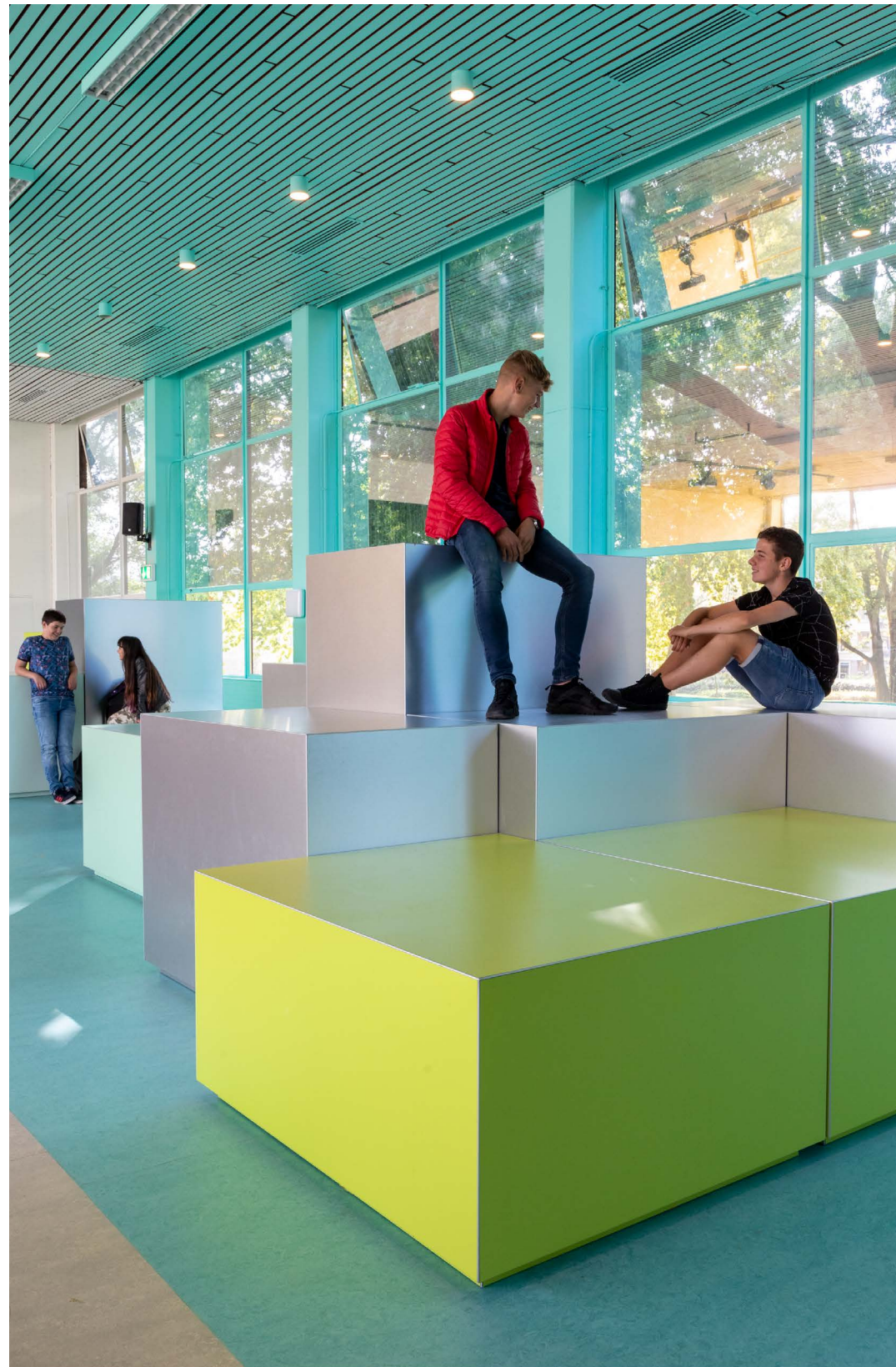
de Marke Zuid