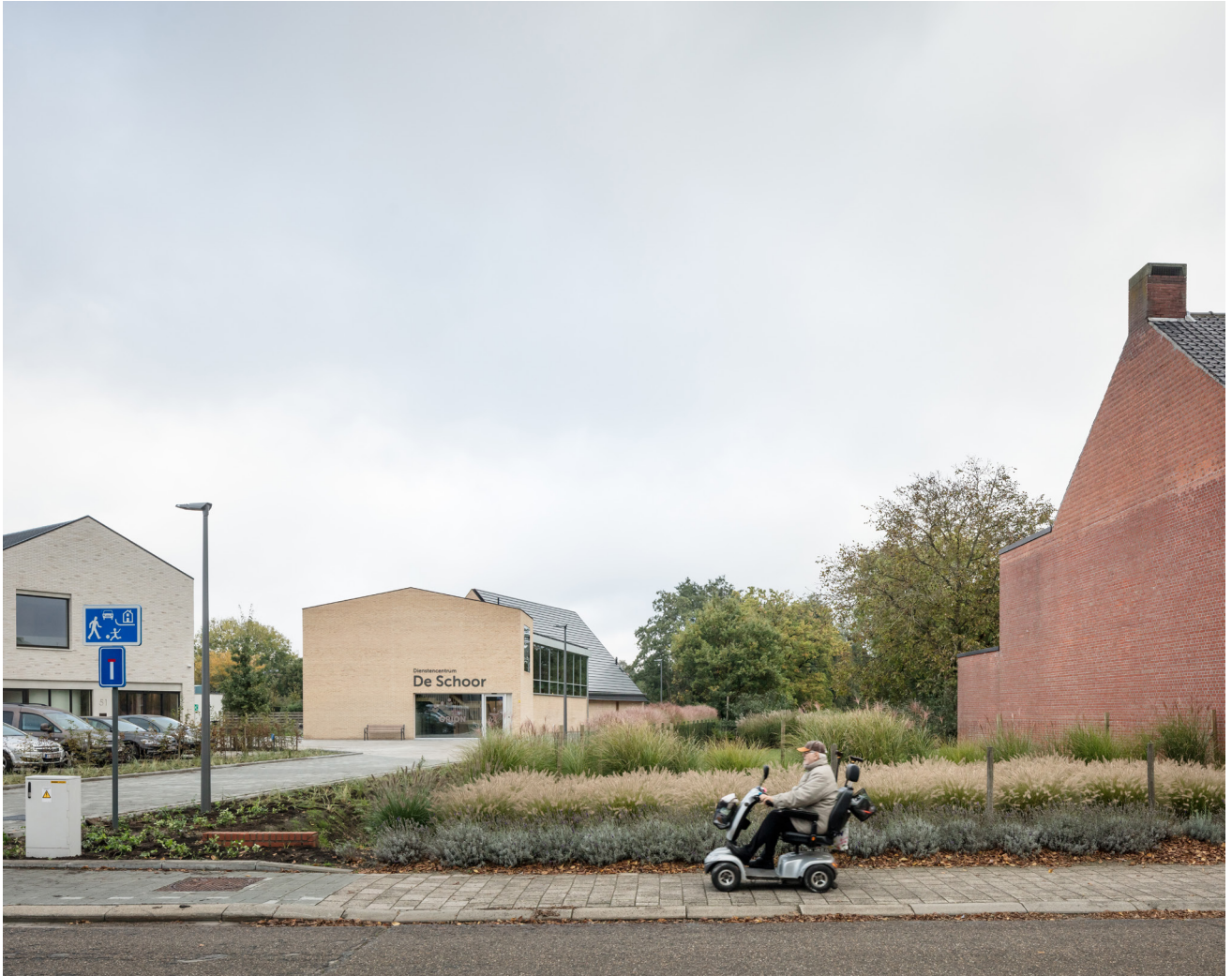
ARC20 ARCHITECTUUR AWARD - De Schoor Turnhout TRANS architectuur | stedenbouw